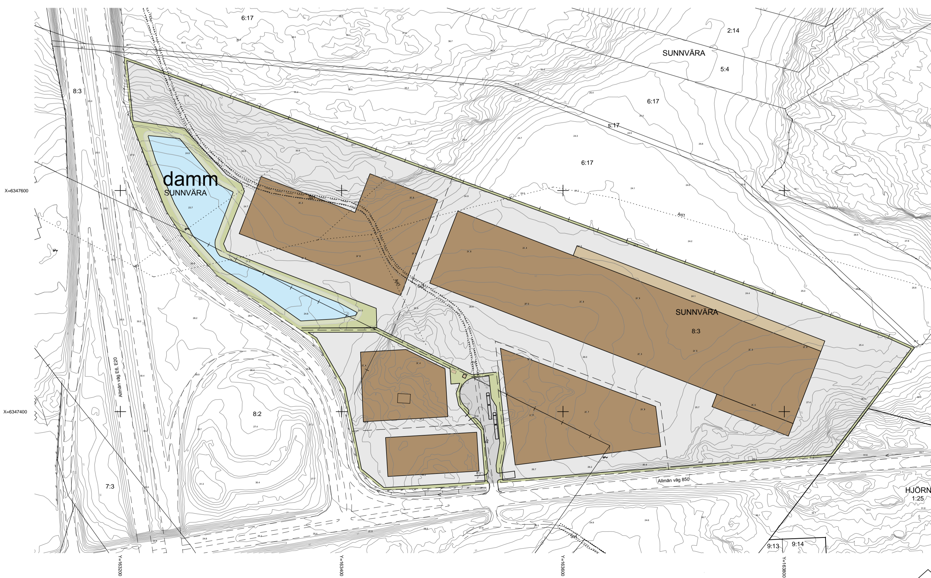
Illustration, skala 1:2000 (A1) 1:4000 (A3)