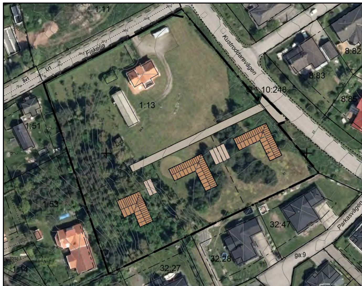
Illustration skala 1:1000 (A2)