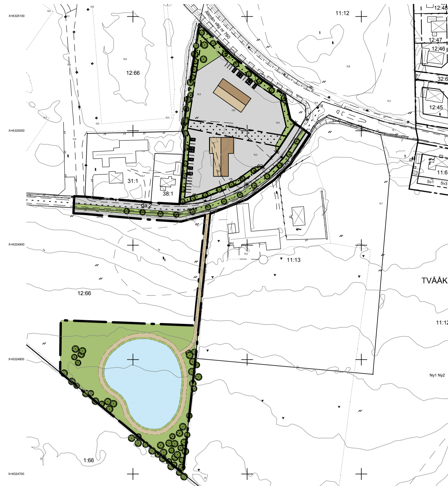
Illustration skala 1:2000 (A1)