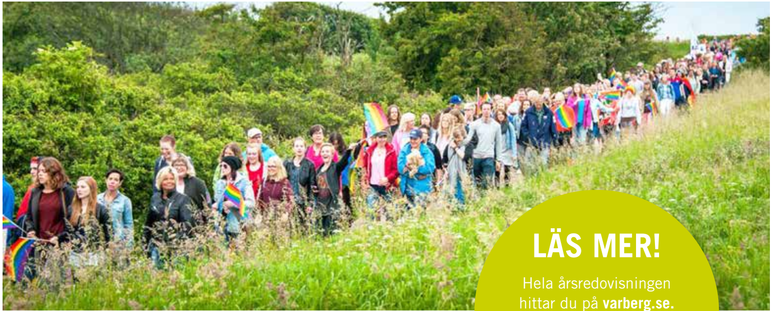
Varbergs första Prideparad arrangerades under VARBERG CALLING for Peace.