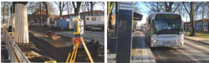
Engelbrektsgatan – under årets upprustningsarbete och i nytt skick.

Flera gatustråk rustades upp i samband med att stadslinjenätet för busstrafik lades om och fick tätare trafik.