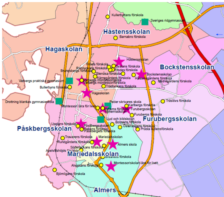
Figur 2: Karta över grundskolor i centrala Varberg

Karta över kommunala och fristående grundskolor i centrala Varbergs kommun. För karta över hela Varbergs kommun se bilaga.