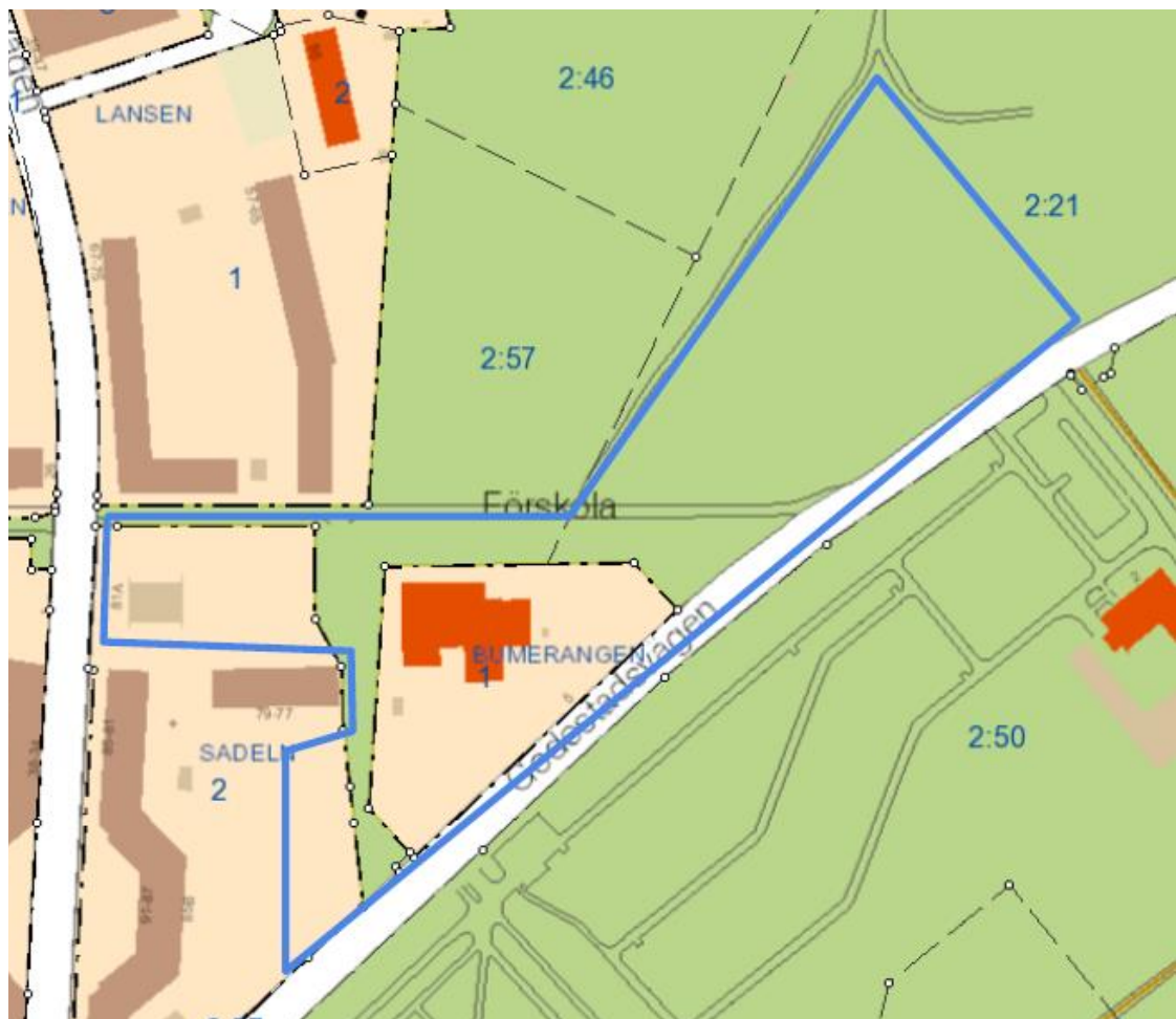
Aktuellt förslag till utökat planområde.