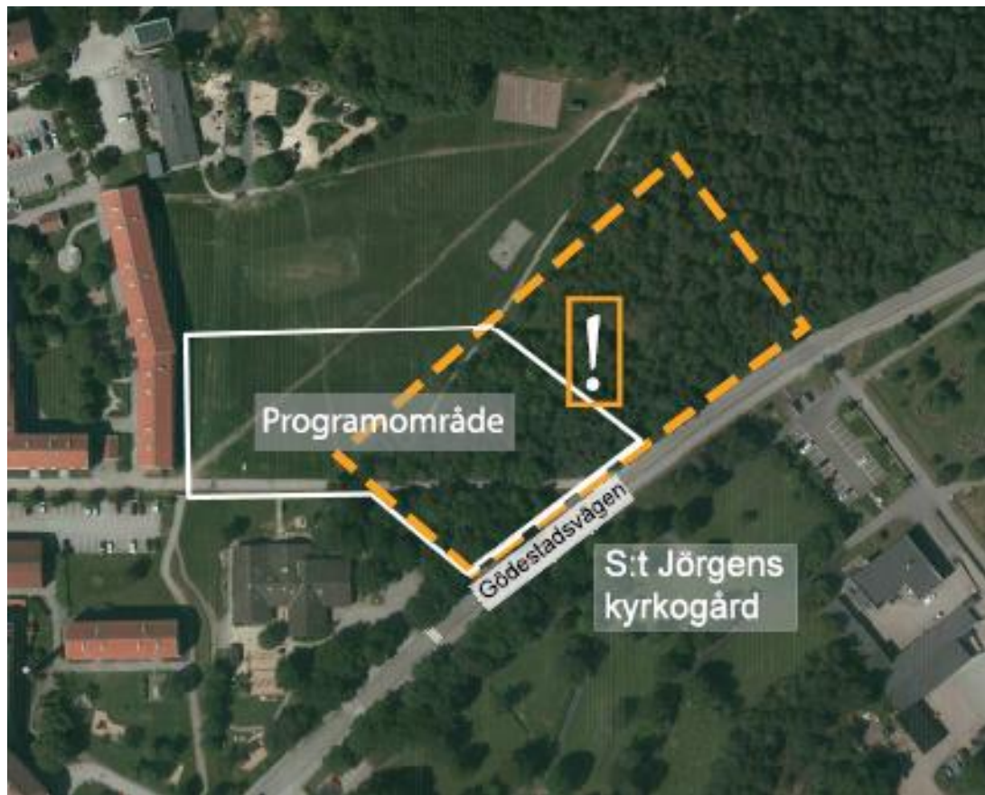
Programområdet samt tidigt förslag till nytt detaljplaneområde (gulmarkerat)