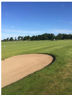
Min utsikt när jag krattade en av banans bunkrar.

Detta ledde till att jag under mina tre veckor fick tillbringa den mesta tiden ute på golfbanan. Det hade jag inte något emot eftersom vädret, med bara några få undantag, bestod av strålande solsken. Eftersom golfbanan täcker en stor yta är det inte praktiskt att vandra runt. Därför fick jag äran att köra runt i en eldriven golfbil. Denna kom väl till pass när jag skulle kratta sandbunkrarna som är utspridda över banan. De stora ytorna av bunkrarna krattas med en maskin men det blir ett okrattat område längs med kanterna. En av mina huvudsakliga uppgifter var därför att kratta detta område för hand. Allt för att underlätta för golfspelarna. Trots att detta är ett fysiskt ansträngande arbete är det också ett mycket tacksamt arbete. Jag fick ofta komplimanger för hur fina bunkarna var. Det som gjorde det hela mer spännande var att det fanns folk ute på banan och spelade samtidigt som jag arbetade. Därför gällde det att vara uppmärksam så att man undvek eventuella golfbollar. Annars var golfspelarna ett trevligt inslag eftersom de erbjöd små pauser och även pratstunder.