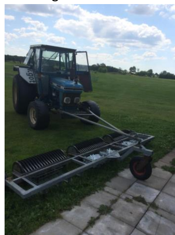
I denna traktorn åkte jag runt på driving rangen och plockade golfbollar. Framför traktorn är bolluppsamlaren fastspänd.

En annan ofta återkommande arbetsuppgift för mig, förutom bunkerkrattning, var att med en traktor och en bolluppsamlare plocka upp golfbollar från klubbens driving range. Driving range är ett stort fält där golfspelarna kan stå och träna på sina slag. Denna var mycket välbesökt och därför behövdes bollar samlas upp i stort sätt varje dag. När korgarna på bolluppsamlaren var fulla så tömde jag dem tillbaka i en maskin där golfspelarna kunde hämta bollar för att åter slå ut dem på driving rangen. Även detta var en intressant och lärorik uppgift. Man vet aldrig vad som händer i livet och någon gång kommer jag kanske ha nytta av att kunna köra en traktor.