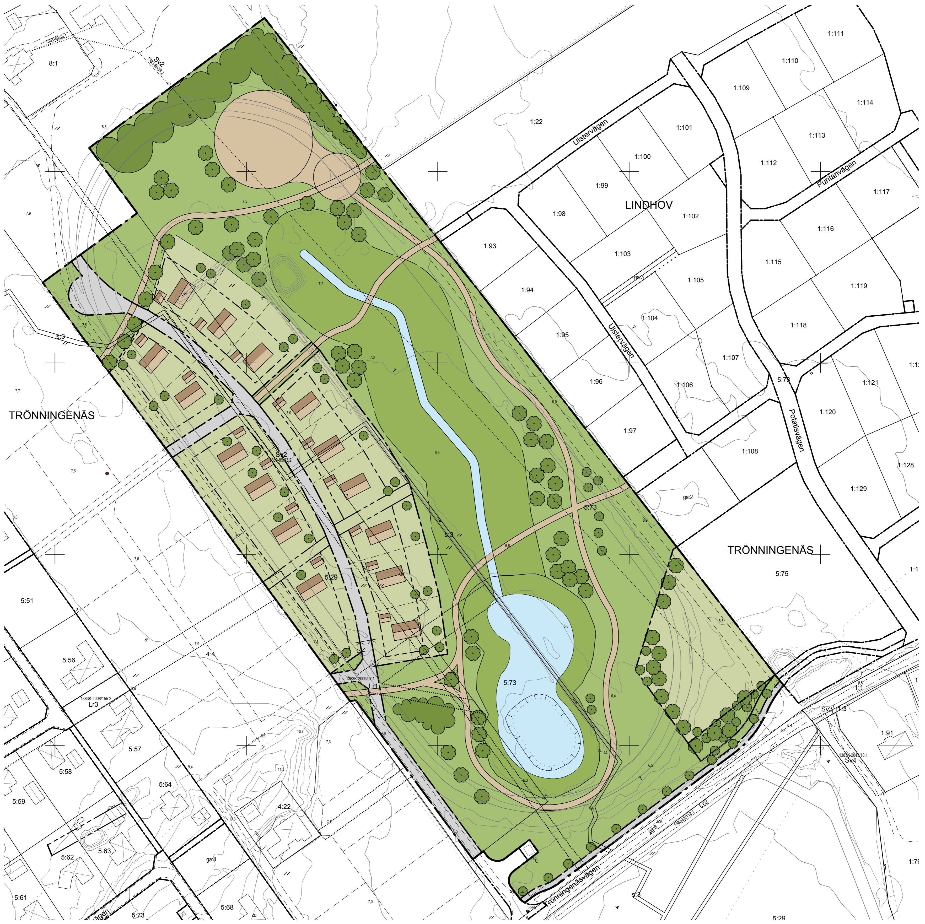
Illustration skala 1:1000 (A1)