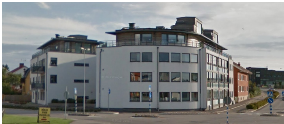
Bostadshus som byggts 2009