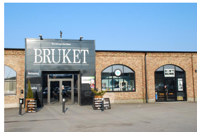
f.d. Gunnebo bruks fabrik inrymmer restaurang- och aktivitetslokaler