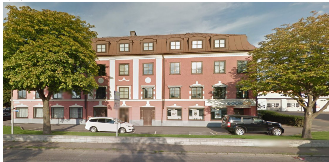
Inspirationsbilder för byggnader med ståtliga fasader mot gatan, Norra vägen och Västra Vallgatan