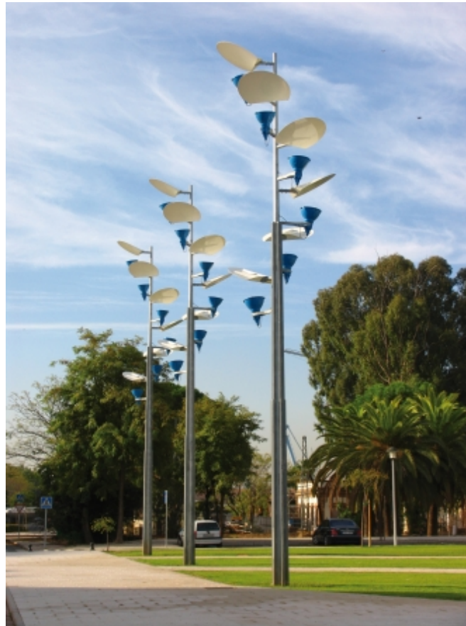
Bilderna illustrerar hur belysning genom storlek, teknik och utformning kan markera det viktiga stråket i staden

Valet av belysningsarmaturer ska göras utifrån gatans önskade karaktär som stadsgata, och därför bör höjden på armaturen vara högst 5 meter vid cykel- och gångbanor. Vid gångpassagera är det särskilt viktigt att belysningen är god.