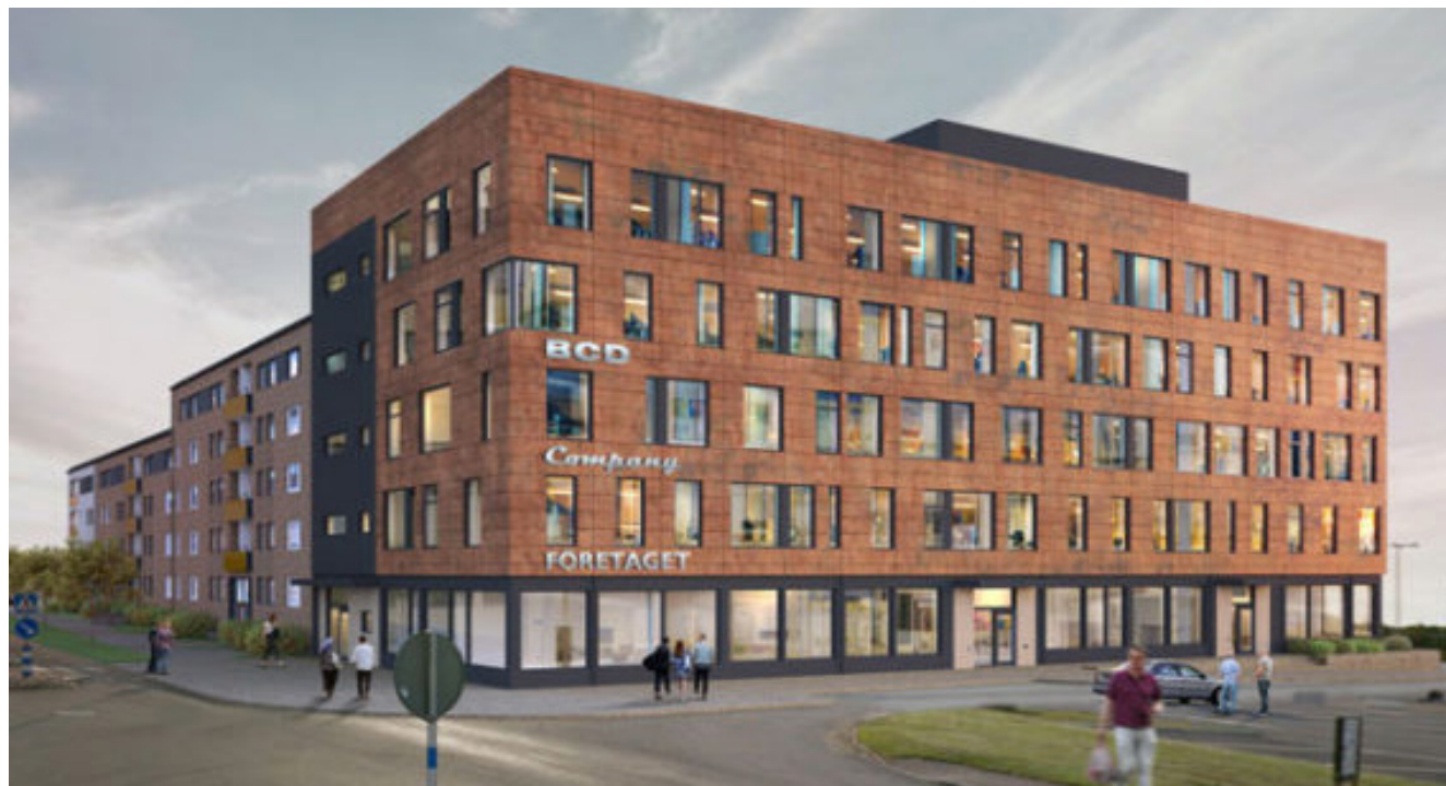
Nybyggnad vid Delfingatan

Bebyggelse ska utformas stadsmässigt i kvartersstruktur och sammanhängande "väggar" i gaturummet. Upp till fyra eller fem våningar, med lokaler i gatuplanet.