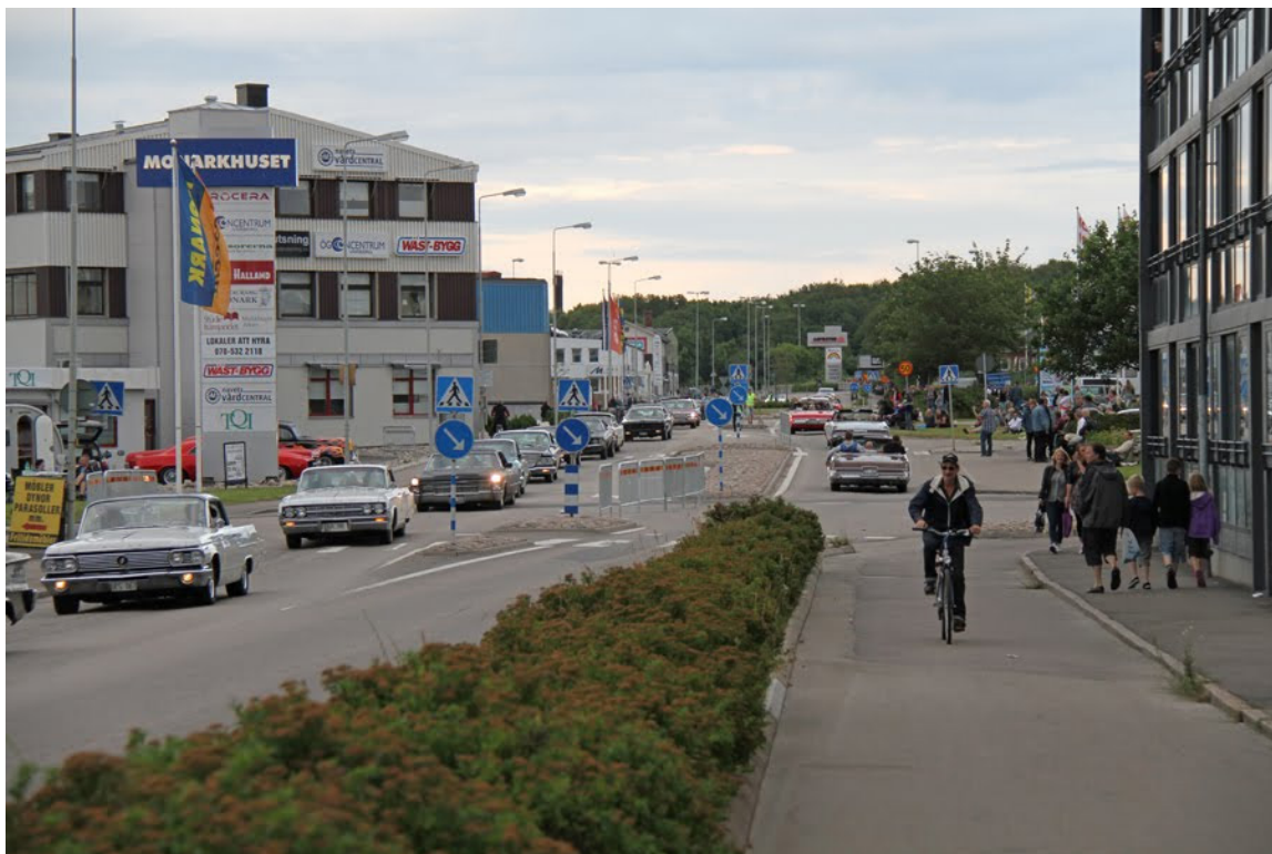
Monarks cykel-fabrik har blivit kontorshotell och butiker