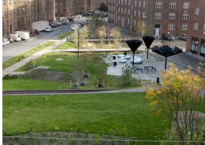
Inspirationsbilder för entrépark vid Göteborgsvägen