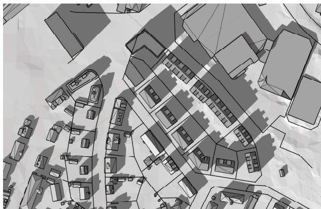
20 mars, kl. 15.00 UTC + 1 vintertid