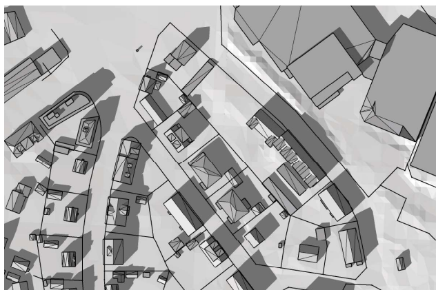
20 mars, kl. 15.00 UTC + 1 vintertid