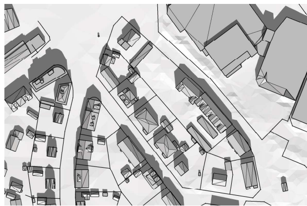
20 mars, kl. 12.00 UTC + 1 vintertid