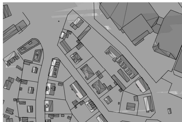
20 mars, kl. 18.00 UTC + 1 vintertid