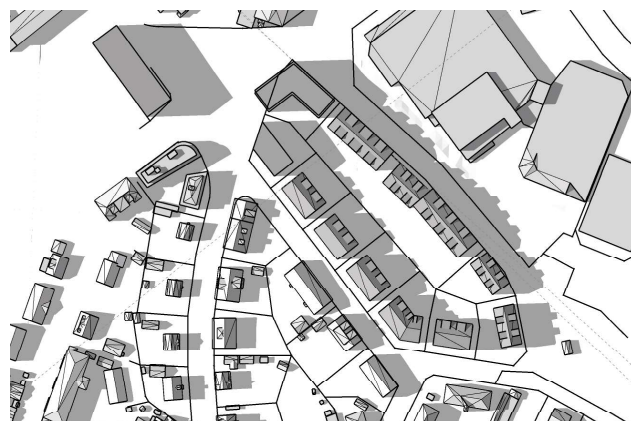
20 juni, kl. 18.00 UTC + 1 vintertid