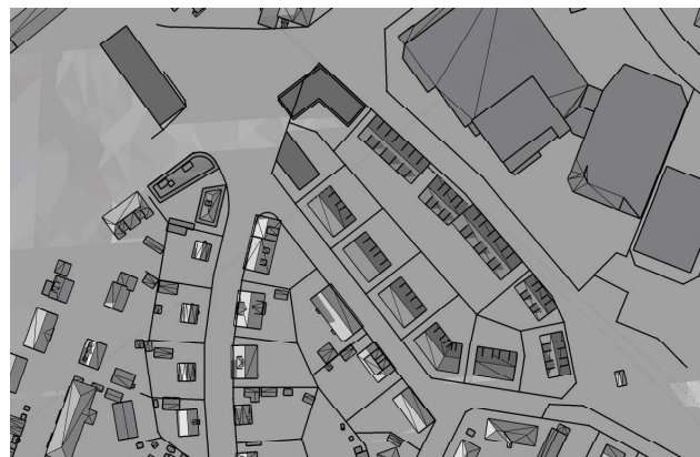
20 mars, kl. 18.00 UTC + 1 vintertid