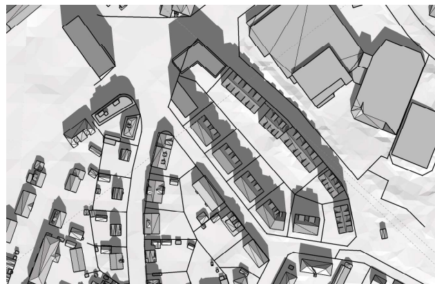
20 mars, kl. 12.00 UTC + 1 vintertid