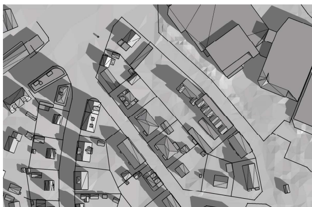
20 mars, kl. 09.00 UTC + 1 vintertid