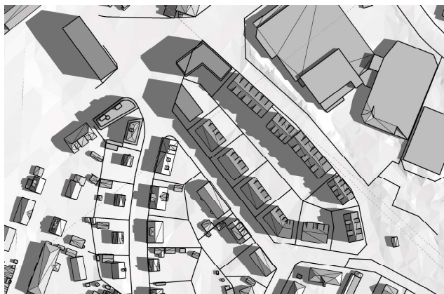
20 juni, kl. 09.00 UTC + 1 vintertid