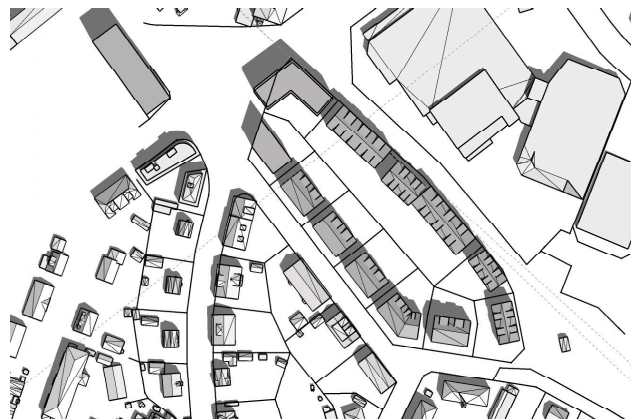
20 juni, kl. 12.00 UTC + 1 vintertid