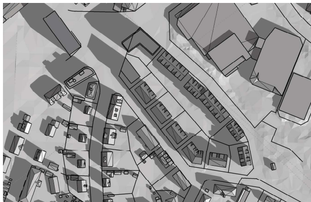
20 mars, kl. 09.00 UTC + 1 vintertid