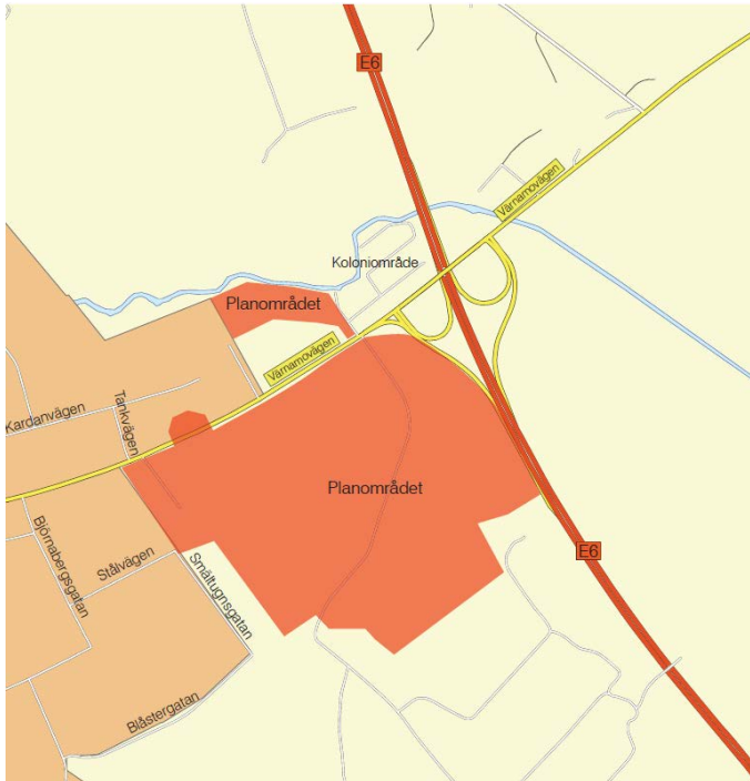
Bild 1 Det föreslagna området för ny detaljplan

man att strandskyddets funktion ändå bibehålls då planförslaget föreslår naturmark utmed Himleån.