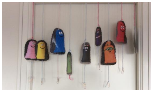
Figur 4. Barbafamiljens meddelande hängde i gemen under respektive figur.

De egengjorda Barbafigurerna fotograferades och laminerades och hängdes upp. Alla figurerna hade ett snöre med ett gem. Barbafamiljen kom med meddelande till barnen. Syftet med aktionen var att hitta en väg att kommunicera. Där Barbafamiljen på ett konkret sätt kunde hjälpa oss i likabehandlingsarbete med att ge uppdrag, ställa frågor och visa dilemman för barnen. Olivestam, & Thorsén (2008) skriver att värdegrundsarbetet bör vara varierande och synliggöras på många olika sätt så att alla blir delaktiga och aktiva. Några exempel på meddelanden är: Barbapappa ville att barnen skulle svara på hans frågor. Barbabok kom med meddelandet läs om ” Snick och Snack i Kungaskogen ” som är en värdegrundande sagobok. Barbamamma ville att vi byggde ett hus åt hennes familj, men vad är en familj? Barbazooos meddelande handlade om en händelse som skett under dagen. Doverborg et al, (2013) beskriver hur vi som pedagoger med hjälp av varierat lärande och vardagliga situationer kan lyfta fram barns olika tankar om samma sak och på så sätt hjälpa barnen att utveckla sin förmåga att se saker ur olika perspektiv. Genom aktionen var förhoppningen att skapa möjligheter för att lyfta fram barnens olika förklaringar, tankar och funderingar. Vi har prövat många olika meddelande, men valt att redovisa resultatet av Barbapappas frågor om hur barnen tycker/tänker kring sig själva och om att vara på förskolan.