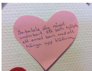
Figur 6. Ett exempel på hur ett kompisjärta kan se ut.