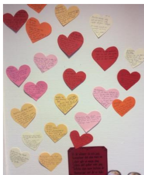
Figur 5. Delar av väggen där våra kompisjärta finns.