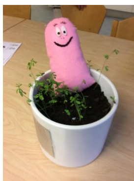
Figur 2. Vår Barbapappa växer upp ur krukans där vi sått frön.