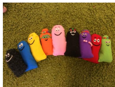
Figur 3. Hela vår Barbfamilj.