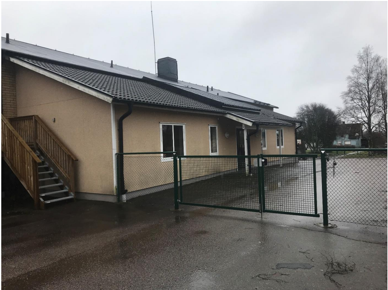
Framsidan av byggnaden

Byggnad på ofri grund, Karl Gustav Storegårdsvägen 5