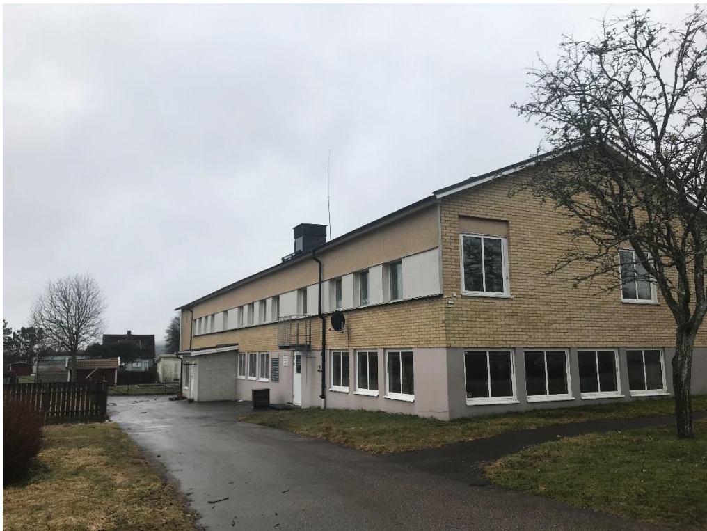
Baksidan av byggnaden

Byggnaden förses med värme från bergvärmepump med elpatron, alternativt oljepanna som spets/reservvärme.